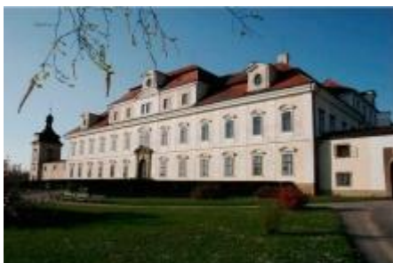
Barokní zámek v Rychnově n. Kn. http://www.kolowrat.com/