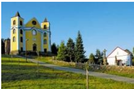
Monumentální barokní kostel v Neratově

při silnici Bartošovice - Orlické Záhoří