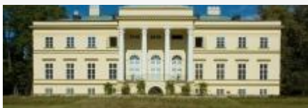
Empírový zámek v Kostelci nad Orlicí www.zamekkostelecno.cz