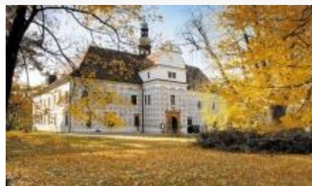
Zámek Doudleby nad Orlicí