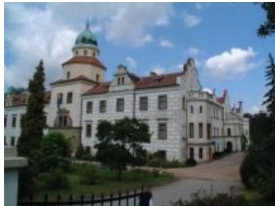
Renesanční zámek v Častolovicích www.zamek-castolovice.cz