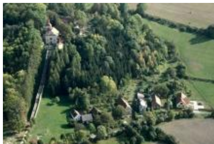
Homol u obce Lhoty u Potštejna